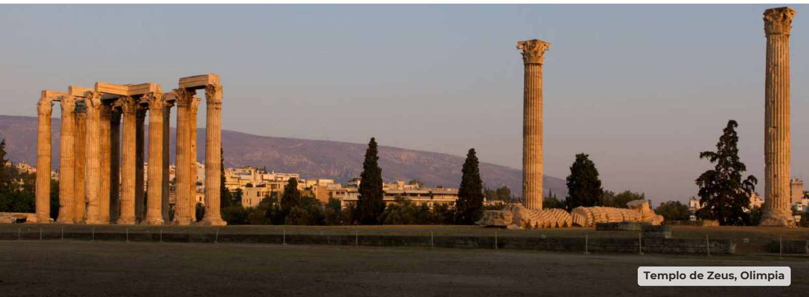
Templo de Zeus, Olimpia

Desayuno en el hotel. Por la mañana realizaremos la visita de Olimpia. Este lugar monopolizó durante casi 10 siglos la vida religiosa y política de la Grecia antigua. Y en este marco armonioso se celebraron por primera vez los Juegos Olímpicos, verdadera tregua sagrada en la que se paraban la guerras. Se visita el Templo de Zeus, el Templo de Hera, el Estadio, el Museo, etc. Continuación del viaje hacia Delfos, atravesando el famoso y nuevo Puente Colgante entre Río y Antirio. Cruzando las pintorescas ciudades de Nafpaktos (Lepanto) e Itea, llegaremos a Delfos. Cena y alojamiento en el hotel.