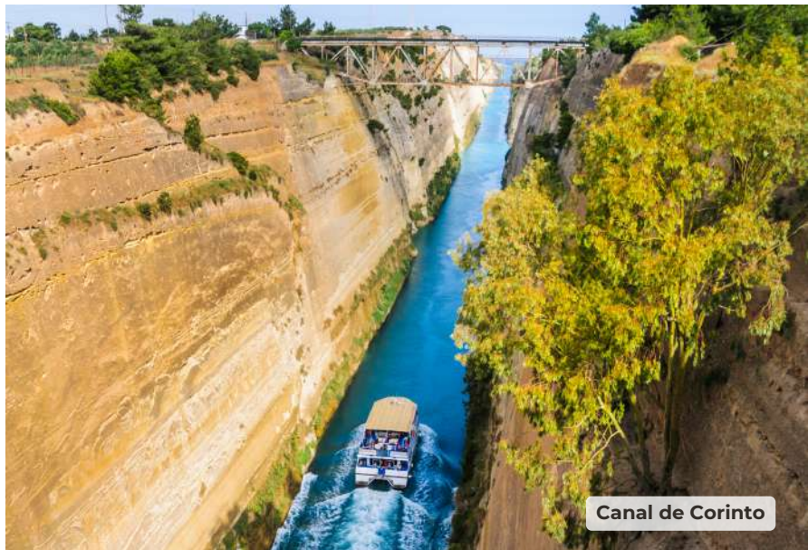
Canal de Corinto