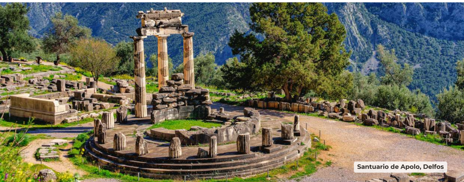
Santuario de Apolo, Delfos

Desayuno en el alojamiento y salida por la mañana para realizar la visita de Delfos, donde se combinan la naturaleza con las leyendas. Muchos años atrás se levantó en este lugar, majestuoso e imponente, el Santuario de Apolo, dios de la belleza y de la música, lugar donde se podían comunicar los hombres con los dioses a través de un oráculo. Visitamos el Santuario de Apolo, el Tesoro de los Atenienses, el Oráculo de la Pitonisa, el museo con el renombrado Auriga de Delfos en bronce y el Agias de Lisipo, entre otras obras maestras de la época. Continuaremos viaje hacia Kalambaka pasando por las ciudades típicas de la Grecia central. Cena y alojamiento en el hotel.